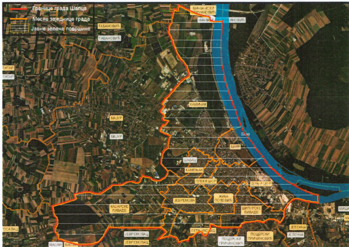
Слика 1. Територија града Шапца и јавне зелене површине

Саставни део Сепарата је графички приказ јавних зелених површина на територији града Шапца.