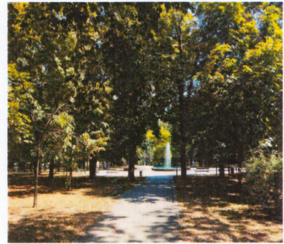
Слика 4. Фонтана у центру парка