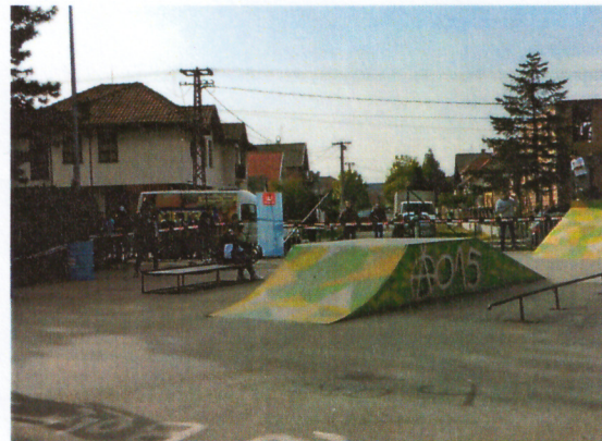
Слика 6. Скејт парк на Живинарнику