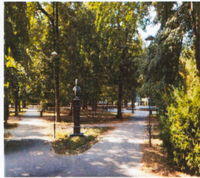
Слика 3. Биста Ј. Веселиновић