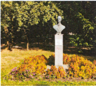
Слика 2. Биста К.Абрашевић