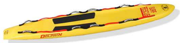
Слика 28. Спасилачка даска