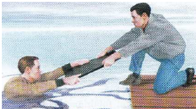
Слика 22. Коришћење приручног средства у спасавању (даска)

Приручна средства су сва она која се у датом тренутку нађу на месту несреће, а могу послужити за спасавање (дугачак штап, дрво, лопта, канап, мердевине) (слика 22).