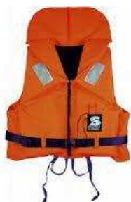
Слика 29. Спасилачки појас

Саставни део опреме на пловним објектима. Појас (слика 29) је испуњен непромочним сунђером, стиропором или ваздухом који може човека да одржи на површини. Појас је одлично превентивно средство и са његовом употребом би требало да буду упознати сви они који бораве (раде) на води или у њеној близини.