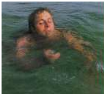
Слика 7. Слаб и уморан пливач

Карактеристике слабог и уморног пливача (слика 7):