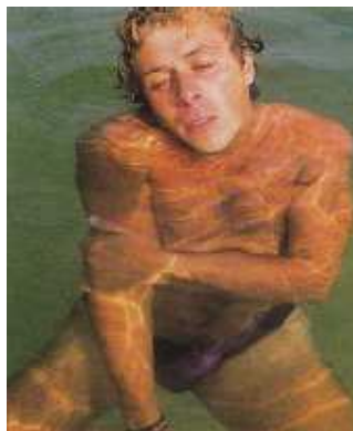
Слика 6. Повређени пливач

Карактеристике повређеног пливача (слика 6):