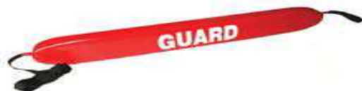
Слика 26. Спасилачка туба (торпедо)

Израђена од непромочивог сунђерастог материјала који би требао по својим карактеристикама да одржи два човека на површини. Туба (слика 26) са једне стране има алке, а са друге карабињер куку којом се туба фиксира на груди дављеника. Туба је спојена за појас који спасилац пребацује преко рамена. Коришћење овог спасилачког средства је лако и ефикасно, под условом да је дављеник у свесном стању. Када се дође до дављеника, додаје му се торпедо који он хвата, затим се ставља око њега и у зависности од његовог стања плива одређеним стилем до обале. Ово средство се може користити како на отвореним тако и на затвореним водама.