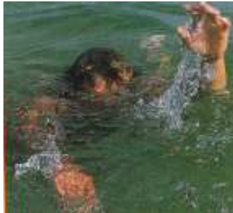
Слика 5. Непливач