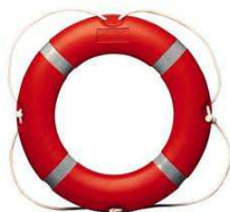
Слика 24. Спасилачки круг

Сличан је спасилачкој лопти. Уже је истих димензија. Ово средство се користи са обале или пловног објекта. Кругом (слика 24) би требало да рукује искусан спасилац јер неправилном употребом можемо нанети повреде дављенику, с обзиром да се круг прави од тежег и чвршћег материјала.