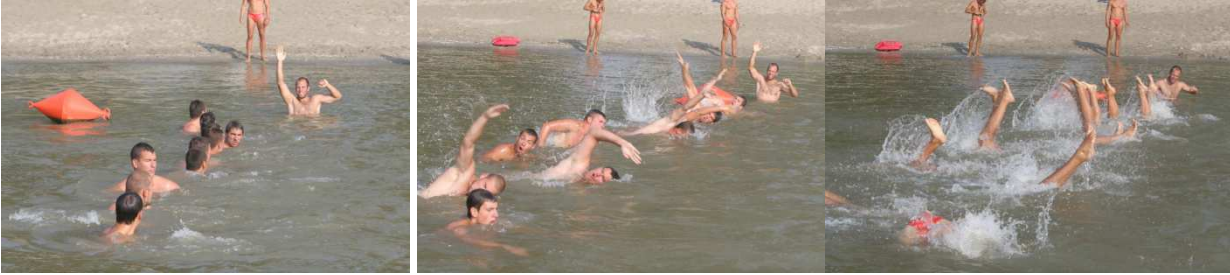
Слика 62. Формација спасилаца за претрагу подручја

Приликом потраге у води спасиоци су поређани у врсту са међусобном раздаљином на дохват руке (слика 62). Врста се креће на команду једног спасиоца који се налази на почетку врсте. Спасиоци роне на команду руководећег спасиоца и приликом потраге крећу се три корака (завеслаја) у напред и два корака (завеслаја) у назад. На тај начин се обезбеђује сигурна претрага терена.