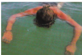
Слика 4. Пливач у несвести

Карактеристике несвесног пливача (слика 4):