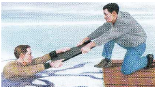
Слика 22. Коришћење приручног средства у спасавању (даска)

Приручна средства су сва она која се у датом тренутку нађу на месту несреће, а могу послужити за спасавање (дугачак штап, дрво, лопта, канап, мердевине) (слика 22).