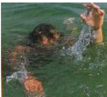
Слика 5. Непливач