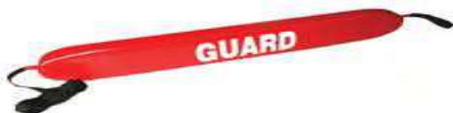
Слика 26. Спасилачка туба (торпедо)

Израђена од непромочивог сунђерастог материјала који би требао по својим карактеристикама да одржи два човека на површини. Туба (слика 26) са једне стране има алке, а са друге карабињер куку којом се туба фиксира на груди дављеника. Туба је спојена за појас који спасилац пребацује преко рамена. Коришћење овог спасилачког средства је лако и ефикасно, под условом да је дављеник у свесном стању. Када се дође до дављеника, додаје му се торпедо који он хвата, затим се ставља око њега и у зависности од његовог стања плива одређеним стилем до обале. Ово средство се може користити како на отвореним тако и на затвореним водама.