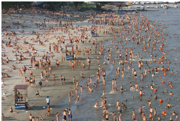
Слика 60. Прелазак капацитета плаже, купачи ван безбедне зоне

Екстремним условима рада се може сматрати и организовање неког ванредног догађаја који узрокује повећан број посетилаца и додатно оптерећује капацитет плаже, што се може окарактерисати и као превелика посећеност или пробијање капацитета плаже. Ситуације преоптерећења плаже је немогуће избећи. Безбедна обележена зона купања стално мења свој капацитет у односу на водостај Саве, па је и то немогуће прецизно одредити. Чињеница је да у једном тренутку уз повољну комбинацију са временским условим број купача прелази капацитет обележене зоне, односно безбедне зоне купања (слика 60). У таквој ситуацији физички је немоће поставити све купаче у безбедну зону, а један број купача ван те зоне се излаже опасности.