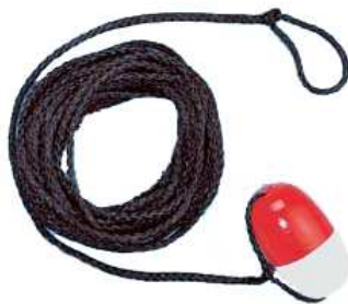
Слика 23. Спасилачка лопта

Лопта у мрежи са канапом (25 м дужине и 5-10 мм дебљине). Спасилачка лопта (слика 23) се лако користи, практична је и прецизна. Лопта се баца на дохват руке дављеника или што даље преко њега, после чега се малом корекцијом са обале довлачи до дављеника, након чега се дављеник хвата за лопту и извлачи на обалу.