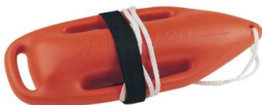
Слика 27. Спасилачка бова

Слична туби по начину коришћења, са том разликом да се њоме не може обухватити дављеник, него се приступа тако да се прво пружи дављенику, а потом се бова мора обема рукама ухватити испод његових руку и тако га транспортовати на сигурно. Бова (слика 27) може да држи на површини три па чак и четири лакше особе. Најчешће се користи на океанима и морима где су таласи велики.