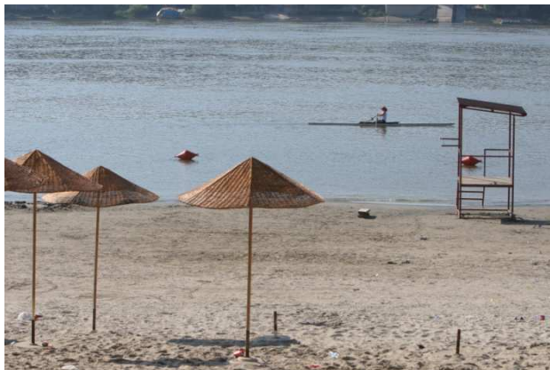
Слика 57. Слабо посећена плажа

Конкретно за плажу „Стари град“ минималан број спасилаца је четири у смени. Три спасиоца седе на осматрачким позицијама, а четврти спасилац је мобилан и допушта замене спасиоцима на позицијама. Четврти спасилац поред обавезе да врши замене, може имати и обавезу да дужи спасилачки чамац у току смене. Овакав начин рада задовољава форму коју прописује члан 10. став 1. тачка 14 Правилника за обављање спортских активности и делатности (Сл. Гласник РС 30/99). Слаб ниво посећености подразумева да тобоган који се налази у оквиру плаже у том режиму рада није у функцији.