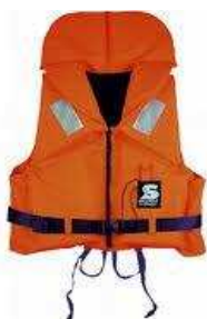
Слика 29. Спасилачки појас

Саставни део опреме на пловним објектима. Појас (слика 29) је испуњен непромочним сунђером, стиропором или ваздухом који може човека да одржи на површини. Појас је одлично превентивно средство и са његовом употребом би требало да буду упознати сви они који бораве (раде) на води или у њеној близини.