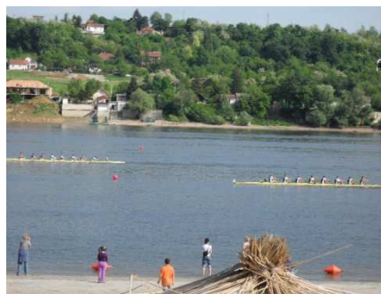
Слика . Спортско такмичење на отвореној води

Спортски догађаји на отвореним водама су увек високог ризика у погледу безбедности. Спасилачка служба мора благовремено добити све податке од организатора о спортском догађају који се организује, предвидети могуће инциденте и унапред се припреми како ће реаговати у њима. Ти подаци се односе на: