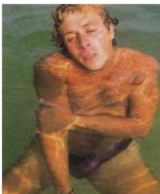
Слика 6. Повређени пливач

Карактеристике повређеног пливача (слика 6):