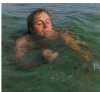
Слика 7. Слаб и уморан пливач

Карактеристике слабог и уморног пливача (слика 7):