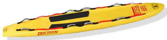
Слика 28. Спасилачка даска

Слична дасци за једрење, са тим да нема јарбол и кормиларно пераје. Даска (слика 28) је веома ефикасно и брзо средство. Користи се када је удаљеност од обале до места несреће велика, па је потребно што брже стићи до дављеника, а са што мање напора. Дављеник се лако може поставити на даску, спасацац легне на даску иза дављеника, весла рукама и тако врши транспорт.